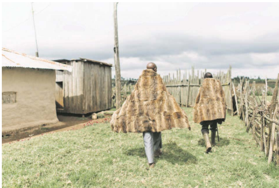
Elkerített falu, Nairobától 200 kilométerre. A települést rétek övezik